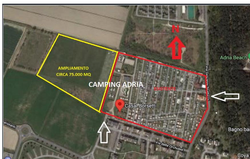
Mappa estratta da google map

Il Campeggio, è ubicato nel Parco del Po a Casalborsetti, con ingresso principale da Via Spallazzi, 30. Sul terreno retrostante, si intende realizzare l'ampliamento, il quale ha ingresso indipendente da Via della Dulcamara.